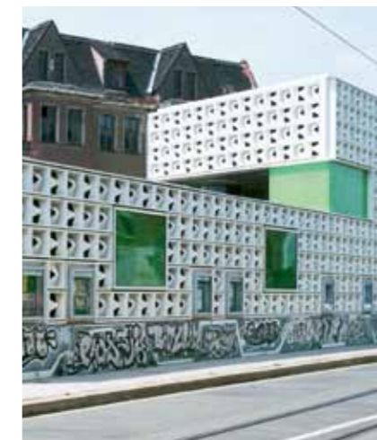
Thomas Völker (2)