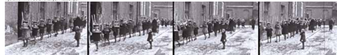
Wytwórnia Filmów Dokumentalnych i Fabularnych

In einem Raster angeordnete Bronzestühle erinnern auf dem Plac Bohaterów Getta an die Möbel, die die Bewohner des Krakauer Ghettos bei ihrer Deportation dort zurücklassen mussten.