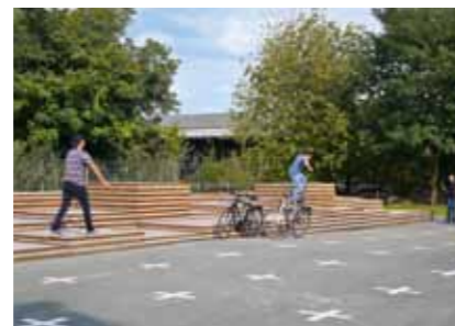
Entlang der Bahnstrecke im westlichen Teil des Parks befinden sich zwischen zwei Wegen ein Skatepark und Ballspielflächen.