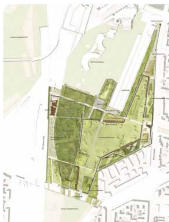
Atelier Loidl Landschaftsarchitekten

In Berlin entsteht auf einer ehemaligen Bahnbrache ein Park mit landschaftlichen Ausmaßen. Die Weite des Parks ist in der dicht bebauten Stadt eine Seltenheit. Das Berliner Atelier Loidl gestaltet die Anlage mit historischen Relikten und modernen Elementen.